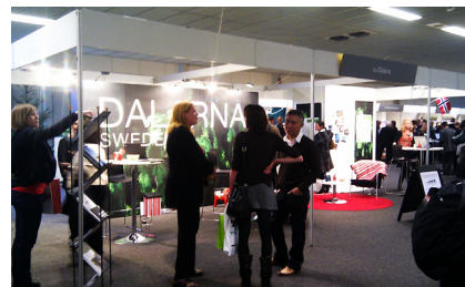
Från Emigration Fair 2011

Holländska ingenjörer håller hög klass, flyttar gärna till Sverige och lär sig snabbt svenska. Följ med VSP, JIV och Automation Region till den 16e upplagan av Emigration Fair i nederländska Utricht den 11-12 februari 2012. Ifjol genomförde vi ett rekogniseringsbesök vilket innebär att vi har goda kontakter och kan skapa unika möjligheter att locka ingenjörer. Anmäl dig och följ med till Utrecht!